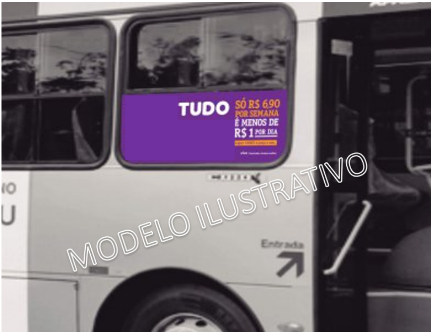
Back Seat (Art. 1º, § 1º, inciso VI)