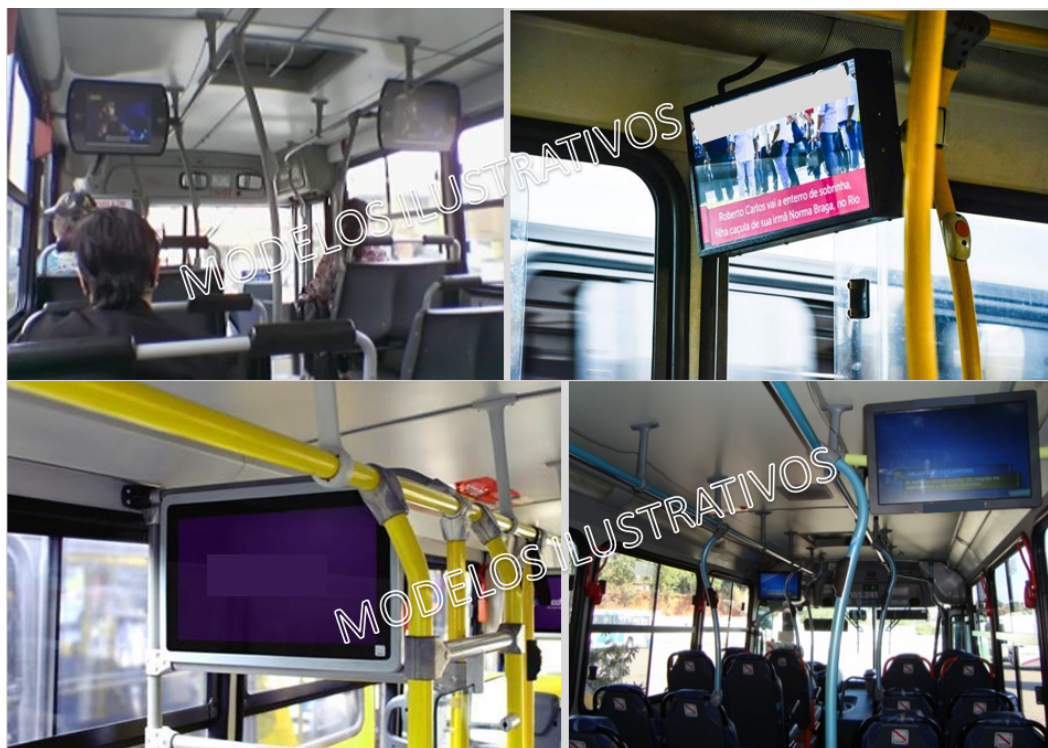
Wi-fi Marketing (Art. 1º, § 1º inciso IX)